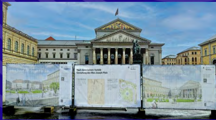
Banner 1,7 x 3,4 Meter

Baustelleninfo, Projektinfo und Aktualisierungen (URL + QR-Code)