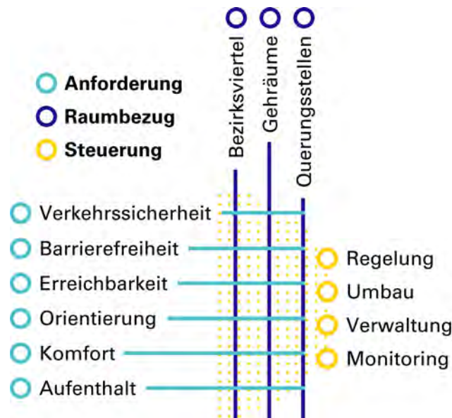
Abb. 4 Anforderungen, Raumbezug und Steuerungsgrößen der Handlungsfelder und Maßnahmenpakete

Bis 2025 soll die Teilstrategie Fußverkehr fertiggestellt und dem Stadtrat zur abschließenden Beschlussfassung vorgelegt werden. Die abschließende Beschlussvorlage soll die Handlungsfelder und Maßnahmenpakete final definieren.