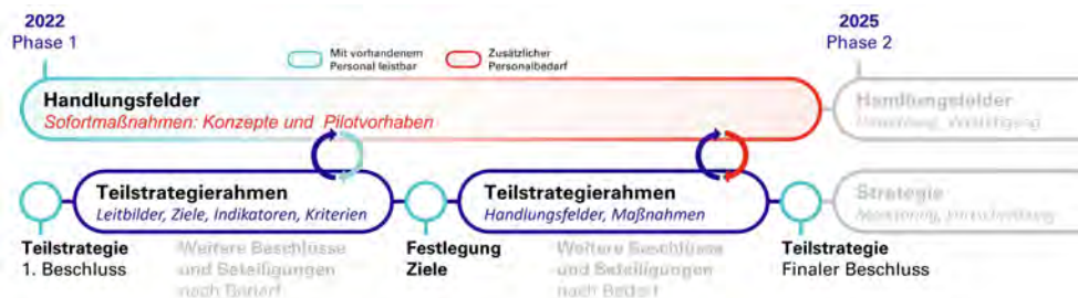
Abb. 3 Zeitplan der Teilstrategie Fußverkehr

Durch die Gleichzeitigkeit von Theorie (Teilstrategierahmen) und Praxis (Sofortmaßnahmen) sollen drängende Themen der Fußverkehrsplanung unmittelbar angegangen werden.