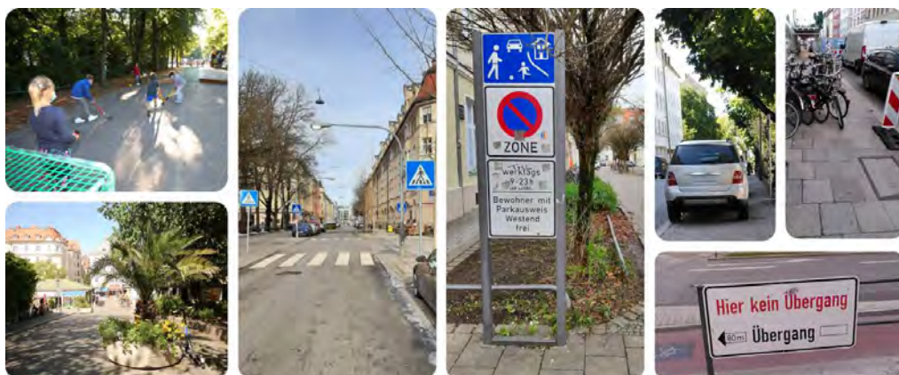
Abb. 2 Impressionen zum Fußverkehr in München

Nun müssen weitere Maßnahmen zur Förderung des Fußverkehrs in die Breite gebracht werden. Der Fußverkehr in München benötigt eine systematische und nachhaltige Planung und Förderung.